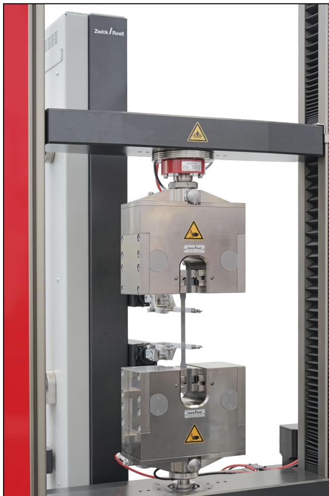
multiXtens II HP mit zwei Messschlitten