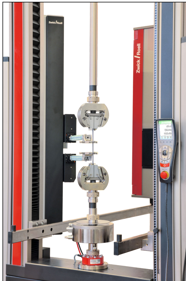
multiXtens II HP

Der multiXtens II HP ist für die „closed loop“ Dehngeschwindigkeitsregelung nach ISO 6892-1 (2009) Verfahren A (1) und nach ASTM E 8-09 Verfahren B freigegeben.