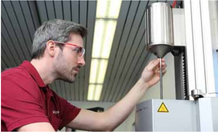
Umfangreiches Portfolio an Kalibrierleistungen