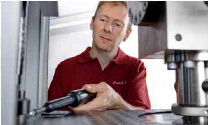
Justagearbeiten im Rahmen der Kalibrierung