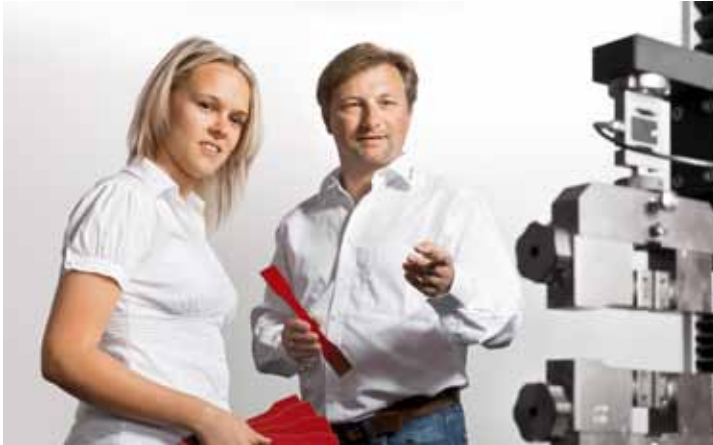
Beratung zu Prüfverfahren und Versuchsdurchführungen