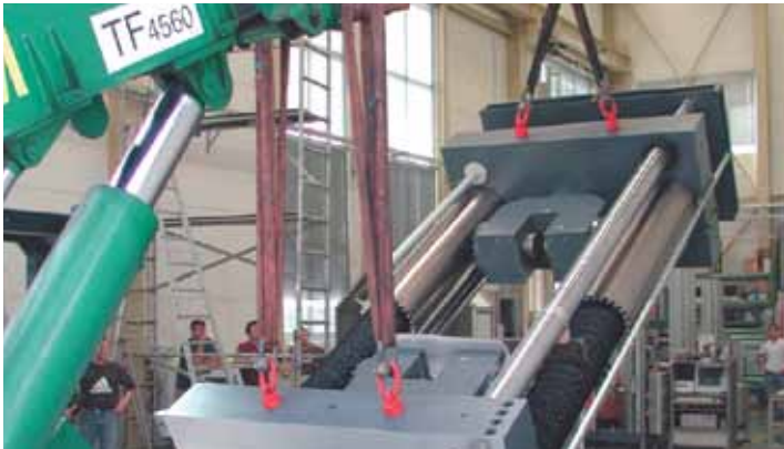
Fachgerechter Transport und Umzug