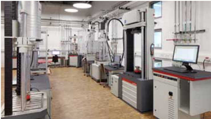
Prüflabor für dynamische Ermüdungsprüfungen