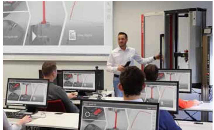
Beste Lernbedingungen dank kleiner Schulungsgruppen