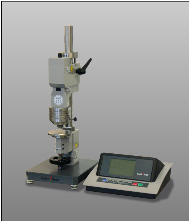
ZwickRoell 3105 combi test Härteprüfgerät